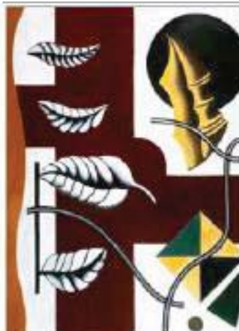
Фернан Леже (1881–1955). Листя й мушля , 1927. Олія на полотні.