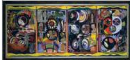
Ейлін Агар /вгорі/ (1899–1991). Автобіографія ембріона , 1933/34. Олія на дошці. 1010 x 2225 x 80 мм