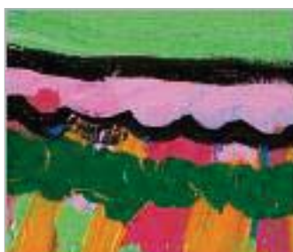
Білорусь, Поліна Пугачевська (9) «Я падаю в небеса»