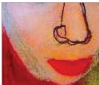
Бразилія, Стефані Сильва ді Альбукеркі (9) «Увіруй» («Істинна краса»)