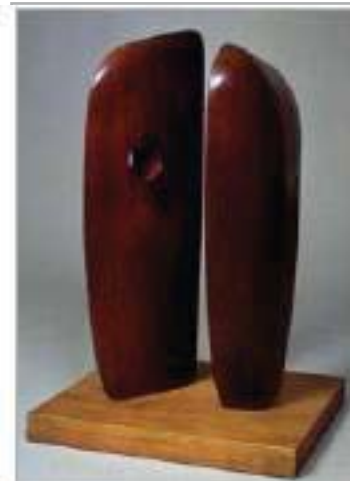
Королівська Дама Барбара Гепворт (1903–1975). Форми в ешелоні , 1938. Дерево. 600 x 710 мм

Порівняно з попереднім твором, атмосфера «Чоловіка з газетою» Рене Магріта зовсім інша. Тут ми бачимо чотири дуже схожих зображення якоїсь дивної, холодної та майже порожньої кімнати. Дивлячись на них, ми мимохіть згадуємо картинку коміксу або гру, в якій глядачеві пропонується знайти певну кількість розбіжностей. Чоловік, винесений у назву картини, з'являється лише в одному квадраті, і здається, ніби хтось «посадив» його на це місце, а потім тихенько прибрав. Загалом уся ця картина – про простір і місце, про ізольовані предмети та самотніх людей, про дивну, сюрреалістичну й бентежливу атмосферу.