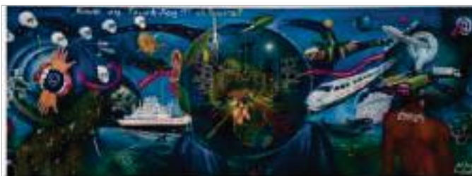
Бодо (нар. 1953). Буремний світ!!! Куди ми йдемо? , 2006. Акрил на полотні, 1530 x 4400 мм