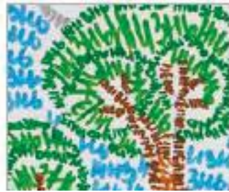
Росія, Рожкова Юлія (16) «Життя і смерть»