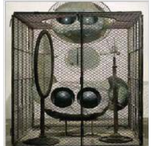
Луїза Буржуа (нар.1911) Чарунка. (Очі й Дзеркала) , 1989/93. Мармур, дзеркала, сталь, скло. 2362 x 2108 мм

Чимало митців обирає головним аспектом своїх робіт грані людської моральності, смертності або страхів сучасної людини. У роботі «Автобіографія ембріона» Ейлін Агар центральним мотивом є «життя» у первісному значенні цього поняття. Тут ми бачимо цілу низку символів, таких як «святкування життя – і не лише життя однієї людини, а Життя взагалі». Агар, яка сама ніколи не була матір'ю, бачила свою картину як одне велике узагальнення: «я хотіла перетворити її на історію, яку звичайно розповідають дитині» (цитуються за виданням: Illustrated Catalogue of Acquisitions 1986+88 , р. 240). Агар переносить нас у дуже специфічне місце – місце, в якому ми знаходимося до початку нашого земного життя.