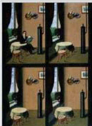
Рене Магріт (1898–1967). Чоловік з газетою , 1928. Олія на полотні.