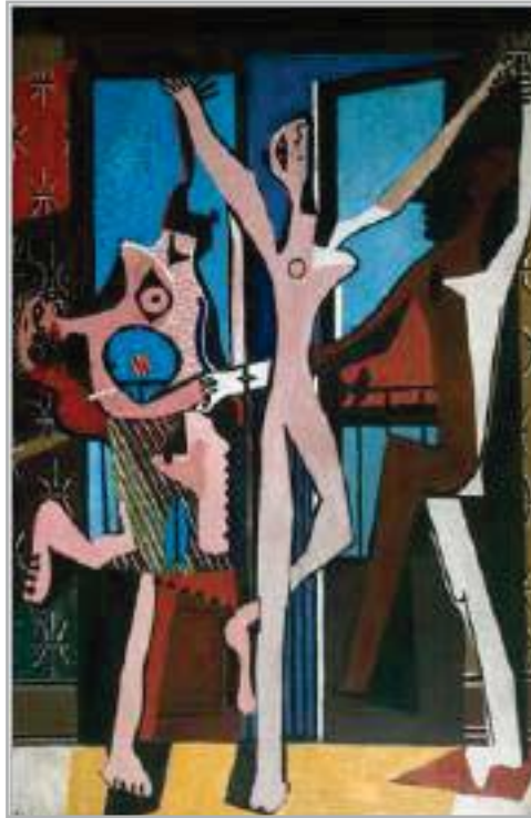
Пабло Пікассо (1881–1973). Три танцівниці , 1925. Олія на полотні (рамка 2153 x 1422 мм: 2232 x 1507 x 107 мм)